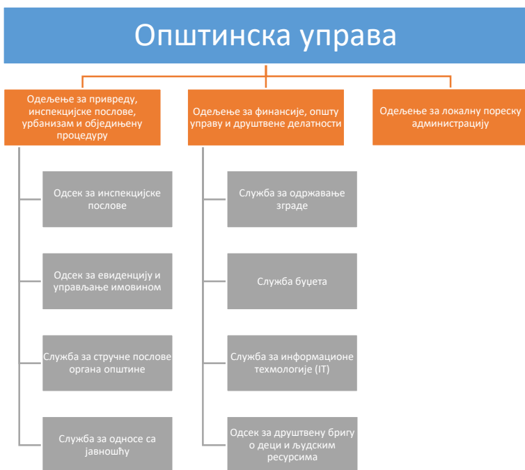
Дијаграм 2: Организациона структура Општинске управе општине Мали Зворник

У Општинској управи се као посебне организационе јединице образују: Кабинет председника општине, Служба буџетске инспекције, Служба интерне ревизије и Главни урбаниста (Дијаграм 3).