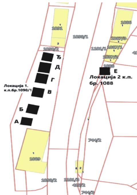
Слика 4. Локације бр.1 и 2