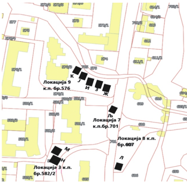
Слика 2. Локације бр.: 3,7,8 и 9