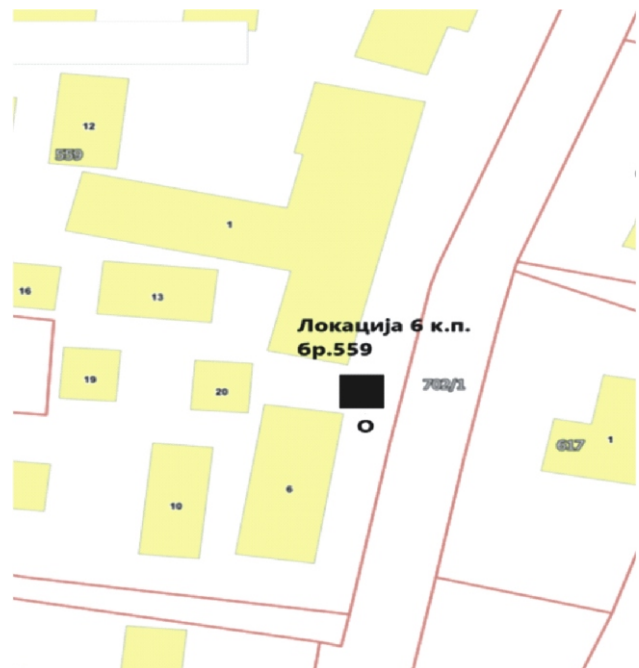
Слика 1. Локација бр.6