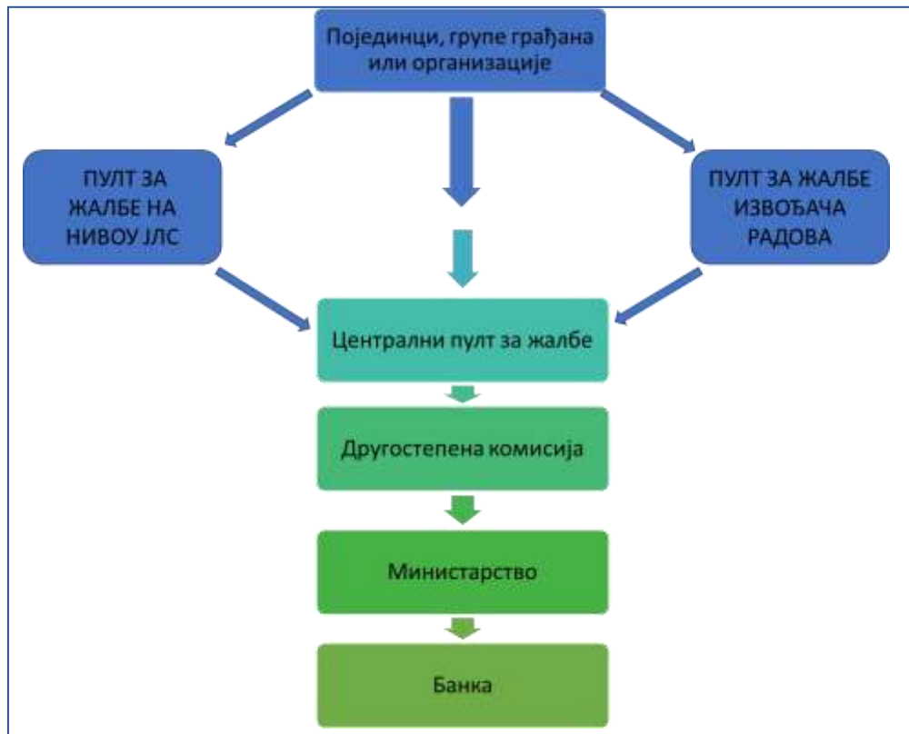
Слика 1. Шема функционисања жалбеног механизма

доноси Другостепена комисија образована решењем министра грађевинарства, саобраћаја и инфраструктуре. Организација ЖМ-а је представљена на слици 1 овог документа.